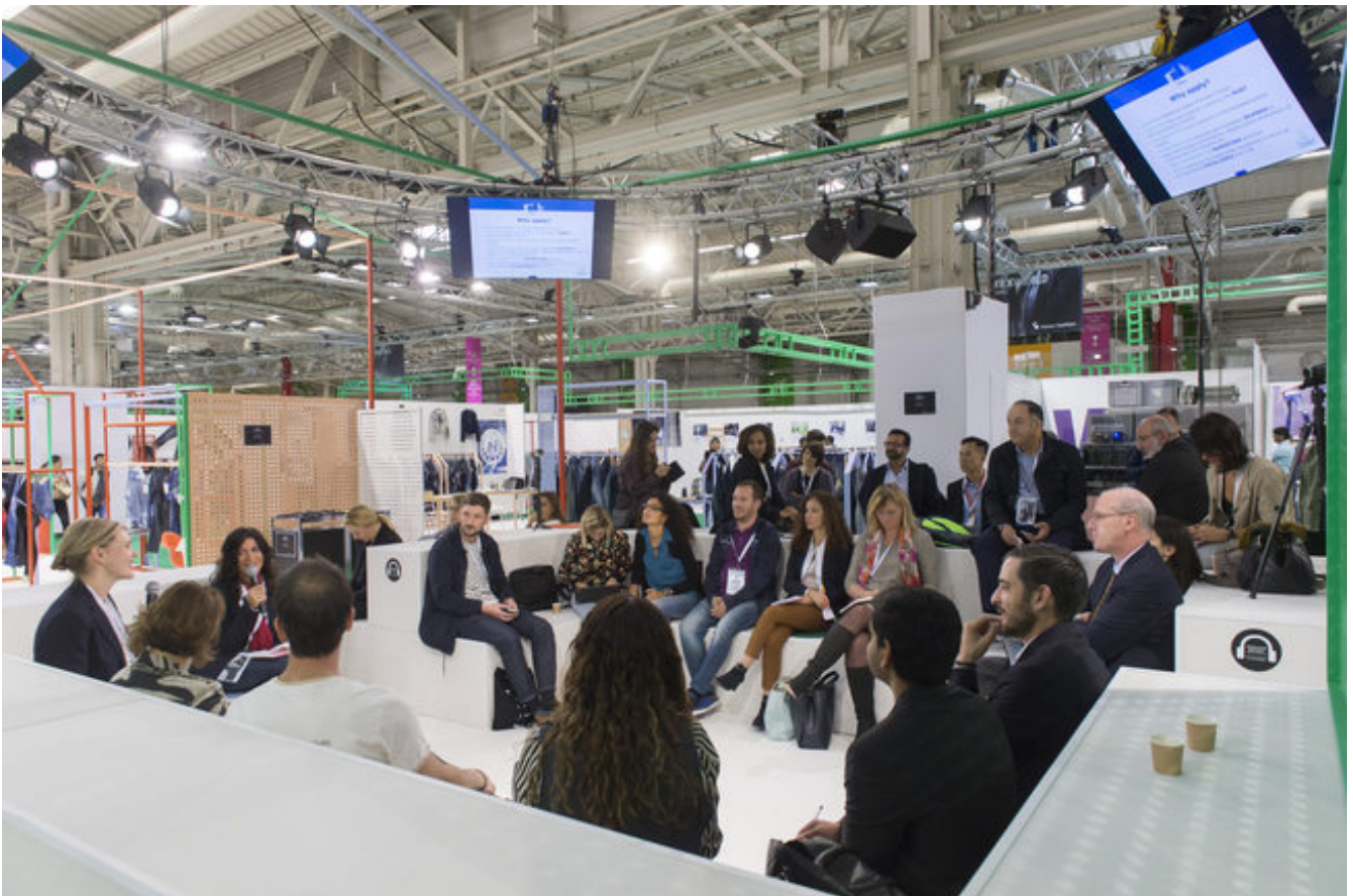
Una conferencia en Texworld Denim - Messe Frankfurt

Texworld y Apparel Sourcing, las ferias de ropa y confección, afincadas en el extraradio parisino, se funden en una sólo esta temporada, que se celebrará del 11 al 14 de febrero y llevará por nombre Texworld Denim. Lo que antes era solamente un espacio se convierte ahora en un salón con nombre propio que acogerá a 80 expositores y que aguarda la llegada de otra feria, Leatherworld, el próximo mes de septiembre.