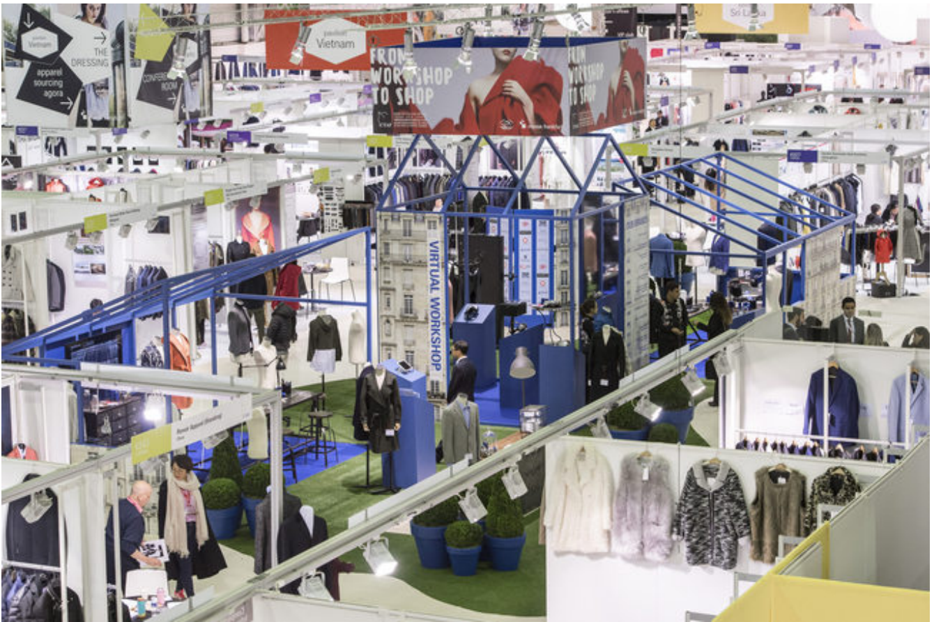
Apparel Sourcing - Apparel Sourcing

El salón del textil Texworld supondrá el regreso de los proveedores turcos con “varias firmas confirmadas”, según la organización. China y Hong Kong representarán de nuevo el mayor contingente extranjero, con Corea del Sur, Tailandia e Indonesia pisando fuerte también esta temporada. Además, el área de bordados y encajes ha aumentado su tamaño en esta edición, igual que han hecho los espacios de seda, tapicería, sastrería y jacquard.